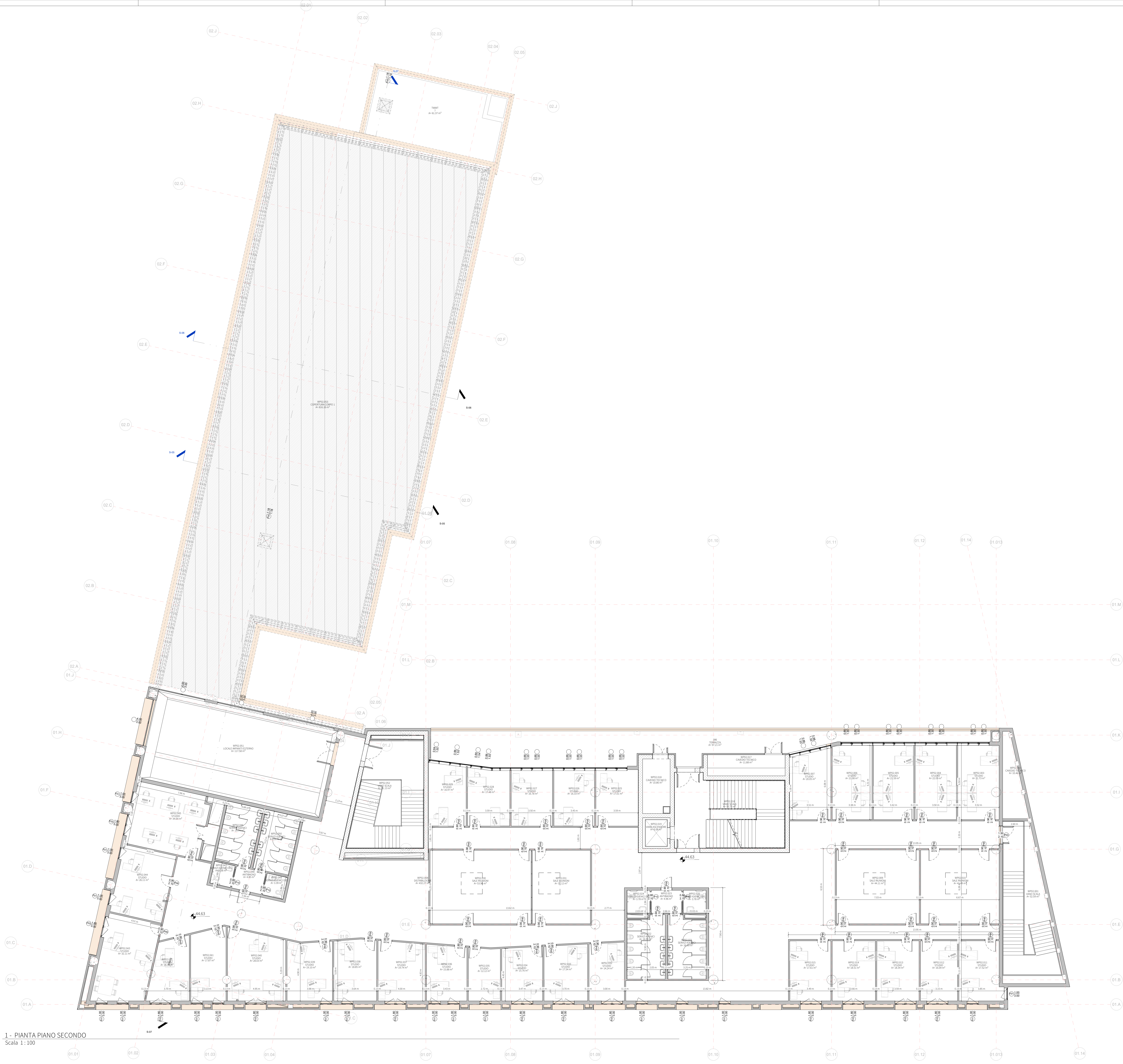
1 - PIANTA PIANO SECONDO Scala 1:100